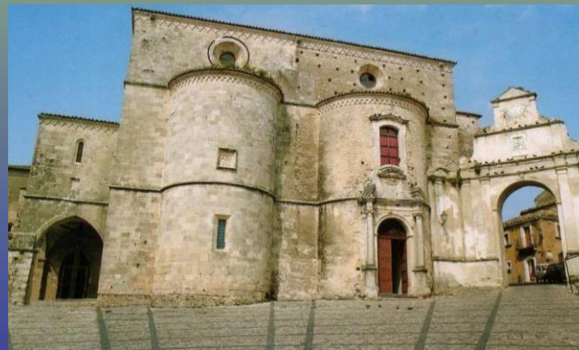
Cattedrale (periodo normanno)