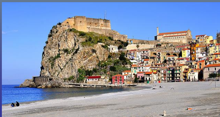
Veduta del castello dalla spiaggia