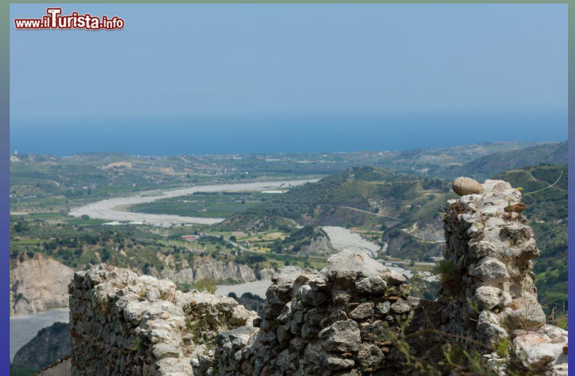
Panorama dal M. Consolino