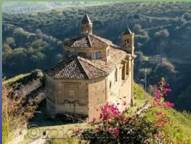
Chiesa dell'Immacolata XVII sec