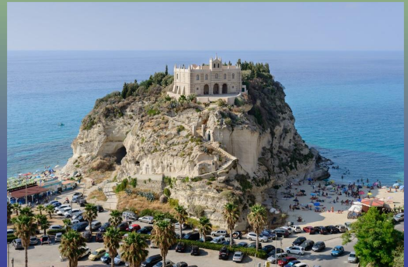
S. Maria dell'Isola