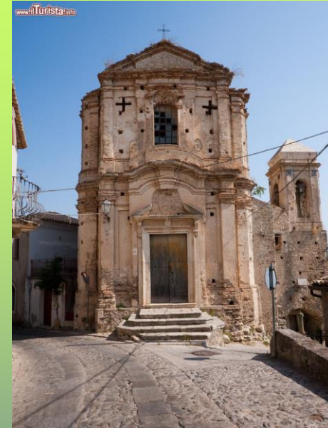
Chiesa di San Martino