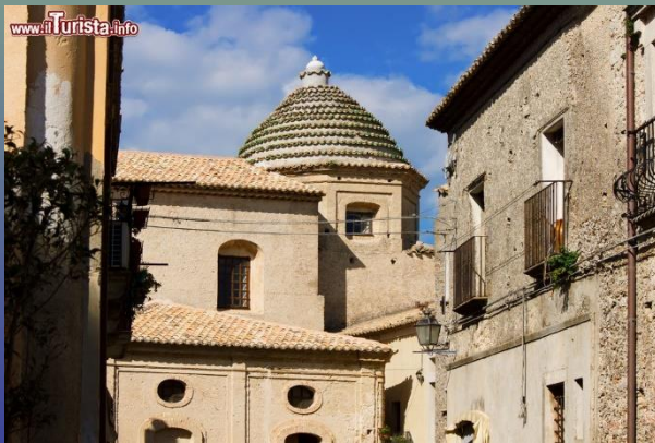
Chiesa Sacro Cuore di Gesù'