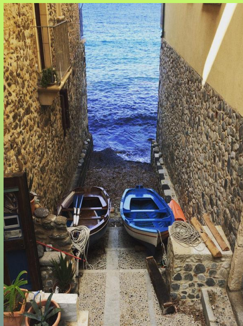
Chianalea: scesa a mare