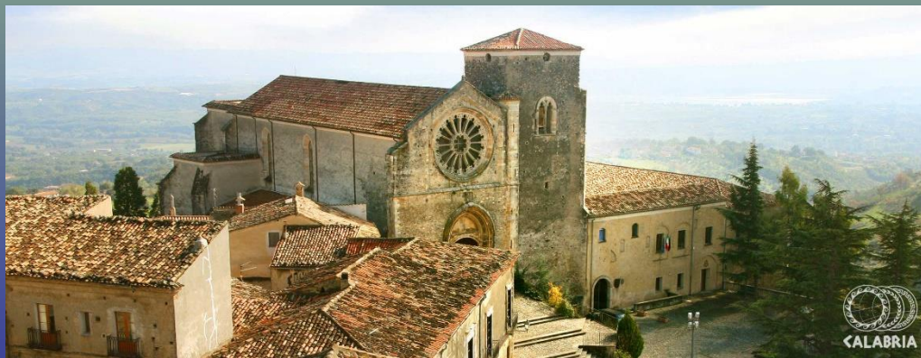
Chiesa S. Maria della Consolazione